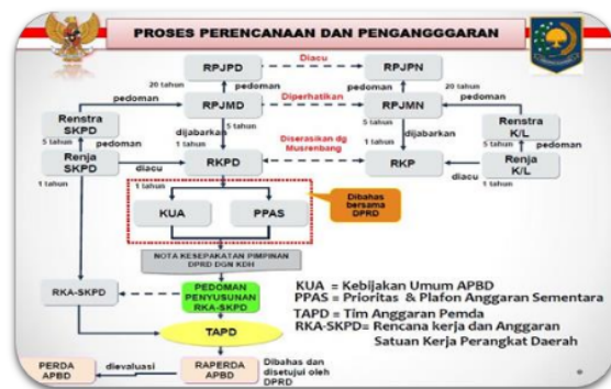
Gambar 1. Proses Perencanaan dan Penganggaran APBD