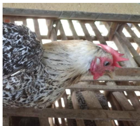
Gambar 8. Bulu leher ayam arab silver

Warna bulu leher menjadi patokan jenis ayam arab gold maupun silver. Pada ayam arab gold bulu leher berwarna coklat sedangkan pada ayam arab silver bulu leher berwarna putih. Berdasarkan table 1 dan 2 frekuensi fenotip menunjukkan 20 sampel ayam arab gold memiliki warna bulu leher coklat kemerahan sehingga frekuensi fenotipnya 100% berwarna coklat. Sedangkan pada 20 sampel ayam arab silver memiliki warna bulu leher putih sehingga frekuensi fenotipnya 100% berwarna putih.