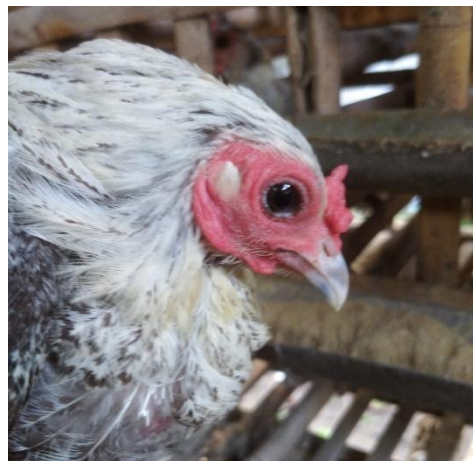
Gambar 4. Paruh ayam arab silver

Paruh pada ayam merupakan bagian utama dari sistem pencernaan. Sebagai hewan monogastrik ayam banyak memakan biji-bijian sehingga bentuk mulutnya berupa paruh yang lancip untuk menyesuaikan pakannya (Rasyaf, 2011). Warna pada paruh ayam berbeda sesuai dengan jenisnya. Warna paruh ayam dapat berupa putih, kuning dan hitam (Edowati et. al., 2019). Dari hasil pengamatan pada ayam arab gold dan silver didapatkan hasil yaitu sebagian besar warna paruh didominasi oleh warna hitam dan sedikit memiliki warna putih diujungnya. Hasil ini sependapat dengan Tamzil et. al., (2021) yang mengatakan frekuensi warna paruh ayam arab didominasi oleh warna hitam kemudian putih dan kuning.