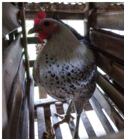
Gambar 2. Ayam arab silver