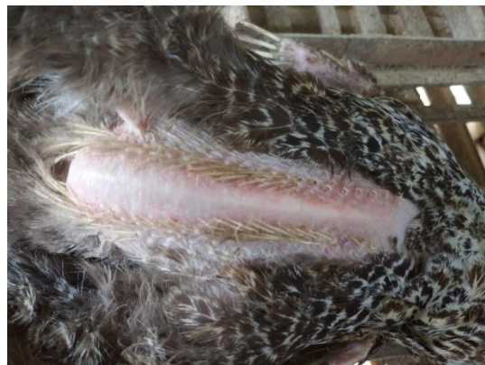
Gambar 4. Kulit ayam arab silver

Kulit pada kedua jenis ayam arab tampak berwarna putih baik pada ayam arab gold maupun silver. Pada table 1 dan 2 frekuensi fenotip warna kulit ayam arab menunjukkan semua sampel memiliki kulit berwarna putih sehingga frekuensi fenotip nya 100% berwarna putih. Dalam hal ini terjadi perbedaan warna kulit pada keterangan yang dikemukakan oleh Sartika et. al. (2016) bahwa warna kulit pada ayam arab silver maupun gold adalah hitam/kehitaman. Dalam keterangan yang dipaparkan oleh Tamzil et. al. (2018) warna hitam pada kulit disebabkan karena adanya pigmen melanin dan lipokrom pada bagian dermis dan epidermis kulit. Dominannya warna putih pada kulit kemungkinan disebabkan sistem persilangan yang sebelumnya telah dilakukan, factor lingkungan dan pakan juga turut andil dalam dominannya warna putih pada ayam arab yang diteliti.