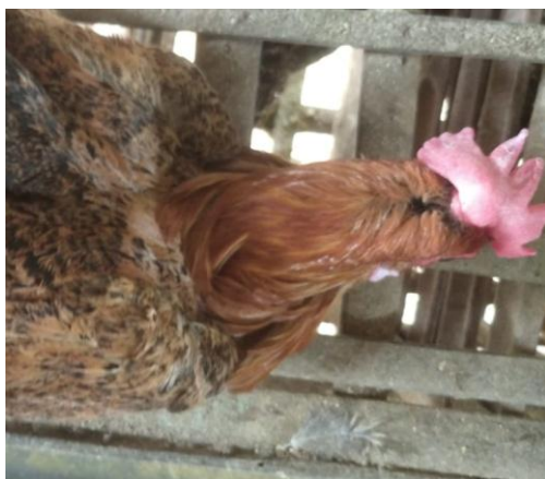
Gambar 7. Bulu leher ayam arab gold