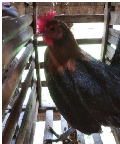
Gambar 1. Ayam arab gold

Hasil pengamatan silver yang dilakukan di Desa Purwodadi, Kediri terhadap karakteristik sifat kualitatif ayam arab gold dan silver disajikan dalam Tabel 1. Penampakan secara fisik ayam arab gold dan silver di desa purwodadi disajikan dalam Gambar 1 dan Gambar 2.