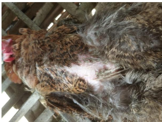
Gambar 3. Kulit ayam arab gold