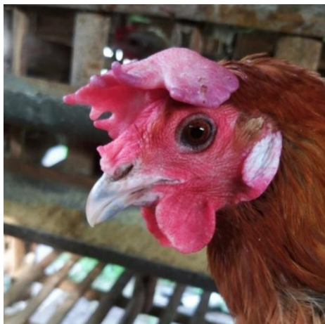
Gambar 3. Paruh ayam arab gold