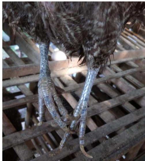
Gambar 6. Shank ayam arab silver

Berdasarkan hasil pengamatan ditemukan warna shank pada ayam arab gold maupun silver menunjukkan warna hitam. Pada tabel 1 dan 2 frekuensi fenotip warna shank dari total 40 sampel yang terdiri dari ayam arab gold maupun silver menunjukkan semuanya memiliki shank berwarna hitam sehingga frekuensi fenotip nya 100% berwarna hitam. Sehingga tidak ditemukan perbedaan fenotip antar ayam arab gold maupun silver. Meskipun terdapat warna kuning kehitaman pada shank namun warna hitam sangat mendominasi pada shank ayam arab.