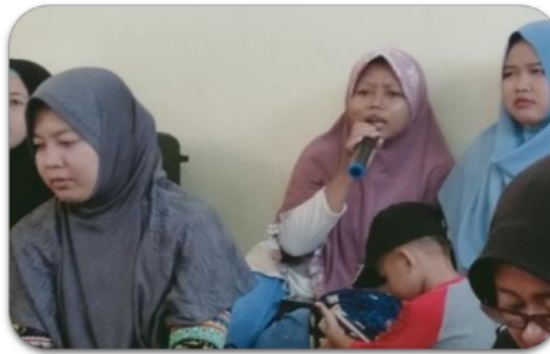
Gambar 7. Peserta pelatihan aktif bertanya selama kegiatan pelatihan