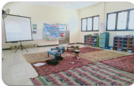
Gambar 2. Ruang Aula beserta Fasilitas LCD dan Proyektor di TKM 295 Rodlotun Nafilah

Lokasi pelatihan di TKM NU 295 Roudlotun Nafilah, Perumahan Griya Peganden Asri, Pongangan Indah, Peganden, Manyar, Gresik Regency, East Java 61151. Pelatihan ini dilaksanakan pada aula sekolah yang berada di lantai dua. Aula ini juga dilengkapi dengan sound sistem dan LCD projector yang dapat digunakan untuk kegiatan pelatihan, pertemuan wali murid dan kegiatan yang bersifat pendidikan. Ruangan aula dengan ukuran 10 x 10 M2 ini, merupakan kelas besar. TKM NU 295 Roudlotun Nafilah juga memiliki ruang kelas untuk kelompok bermain dan sekolah dasar. Pelatihan pengasuhan orang tua anak usia dini era disrupsi merupakan kegiatan yang dilaksanakan oleh Universitas Muhammadiyah Gresik bekerjasama dengan TKM NU 295 Roudlotun Nafilah. Adapun gambaran umum lokasi pelatihan dapat dilihat secara visual seperti gambar 2.