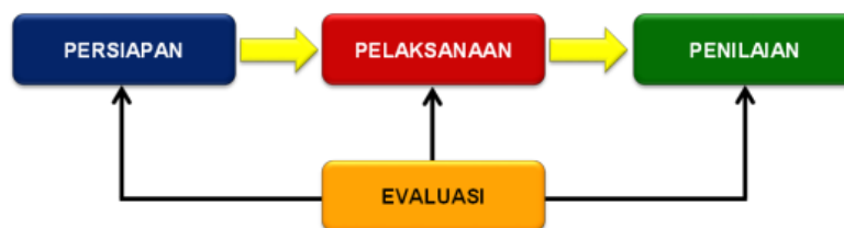
Gambar 1. Proses Pelaksanaan Pelatihan

Metode pelaksanaan pelatihan pengasuhan orang tua anak usia dini era disrupsi menggunakan community development . Metode pelatihan dengan ceramah, diskusi, dan brainstorming group (Stroebe et al., 2010). Proses pelaksanaan pelatihan ini seperti pada gambar 1 sebagai berikut: