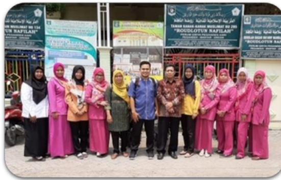
Gambar 3. Tim Pelatihan UMG, Mahasiswa dan Staff TKM NU 295 Roudlotun Nafilah