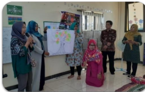
Gambar 6. Peserta pelatihan ikut serta melakukan presentasi pohon cita-cita di depan peserta dan tim pelatihan

pola asuh orang tua di era disrupsi melalui beberapa tahap meliputi: (1) kehadiran peserta pelatihan, (2) keaktifan peserta pelatihan selama kegiatan berlangsung, dan (3) keikutsertaan peserta pelatihan dalam diskusi kelompok kecil. Implementasi penilaian pelatihan yakni penilaian kehadiran peserta pelatihan dari undangan 70 peserta dengan tingkat kehadiran 48 peserta pelatihan, sehingga 70% peserta pelatihan menghadiri undangan pelatihan. Keaktifan peserta pelatihan dalam kegiatan pelatihan terlihat dari keaktifan dalam bertanya dan berdiskusi terkait dengan permasalahan pengasuhan anak, lama penggunaan teknologi (gadget) yang baik untuk anak, dan kiat-kiat orang tua mendampingi anak untuk belajar dari rumah. Keaktifan peserta juga terlihat dari keseriusan peserta pelatihan dalam mendengarkan materi selama kegiatan pelatihan berlangsung. Keikutsertaan peserta pelatihan dalam diskusi kelompok yakni masing-masing peserta pelatihan aktif menyampaikan diskusi kelompok tentang “pohon cita-cita” yang dibuat oleh kelompok kecil. Pohon cita-cita ini adalah berisikan tulisan dan keinginan orang tua untuk mewujudkan cita-cita putra dan putrinya. Setiap kelompok menyampaikan ide dan gagasan di depan kelompok lain secara bergiliran. Kelompok lain memberikan argumen, pendapat, serta saran untuk ide dan gagasan kelompok tersebut. Adapun keikutsertaan peserta pelatihan dalam diskusi kelompok kecil dan keseriusan peserta pelatihan secara visual seperti pada gambar 6 berikut ini: