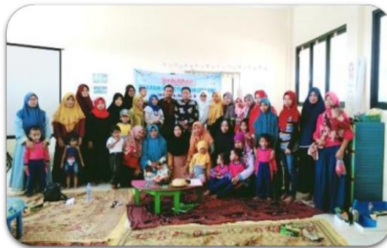
Gambar 4. Para Peserta Pelatihan dan Staff TKM NU 295 Roudlotun Nafilah

Pelatihan ini di ikuti oleh peserta dari wali murid TKM NU 295 Raoudlotun Nafilah. Dengan sasaran pelatihan sejumlah 48 peserta pelatihan yang terbagi dalam dua gelombang yakni gelombang pertama tanggal 29 Januari 2020 dengan jumlah konfirmasi kehadiran 25 peserta pelatihan, dan gelombang kedua yakni 15 Februari 2020 dengan jumlah konfirmasi kehadiran 23 peserta pelatihan. Tanggal dan pelaksanaan pelatihan pengasuhan orang tua anak usia dini era disrupsi dilaksanakan pada bulan Januari dan Februari 2020. Jadwal pelatihan tertuang pada tabel. 1 seperti berikut: