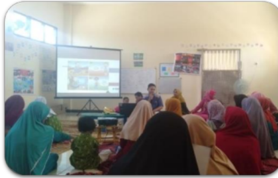
Gambar 5. Penyampaian Materi oleh Tim Pelatihan

Adapun penyampaian materi saat pelaksanaan pelatihan dapat di lihat secara visualisasi seperti pada gambar 5 sebagaimana berikut: