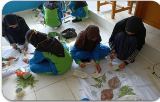
Gambar 3. Pelatihan dan Praktek Pembuatan Produk Ecoprint

Untuk mengetahui tingkat keberhasilan pada kegiatan ini maka tim pengabdian melaksanakan tahap evaluasi. Tahap evaluasi dengan metode pengamatan pada produk ecoprint yang dihasilkan peserta dan kuesioner. Dari hasil kuesioner untuk evaluasi kegiatan dari peserta yang berjumlah 12 untuk SMP N 10 Muaro Jambi dan 15 peserta untuk MTs N 8 Muaro Jambi terkait kebermanfaatan kegiatan, penyampaian materi, peralatan pendukung yang disediakan, praktik kegiatan dan hasil karya dari pelatihan disajikan pada Gambar 4. Gambar 4 menunjukkan penilaian rata-rata dari peserta untuk setiap aspek pada 2 sekolah yang berbeda. Skor 1 menunjukkan sangat tidak baik, skor 2 menunjukkan tidak baik, skor 3 menunjukkan cukup, skor 4 menunjukkan baik dan skor 5 menunjukkan sangat baik. Pada aspek kebermanfaatan kegiatan dari peserta di dua sekolah diperoleh skor sangat baik. Aspek tersebut menunjukkan kegiatan ini menambah keterampilan yang dimiliki siswa. Dari semua aspek yang dievaluasi rata-rata menunjukkan skor lebih dari 4 dimana menunjukkan kegiatan ini dapat berjalan dan diterima dengan baik. Berdasarkan hasil evaluasi kegiatan yang telah dilaksanakan saat ini, besar harapan sekolah untuk dapat dilaksanakan keberlanjutan program ini karena bermanfaat bagi siswa dan sekolah.