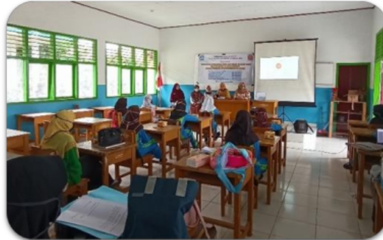
Gambar 2. Kegiatan Sosialisasi Ecoprint

ditunjukkan Gambar 2. Kegiatan dilaksanakan dari pukul 08.00 WIB. Peserta merespon baik program ini. Kegiatan dilanjutkan demonstrasi pembuatan produk ecoprint oleh tim pengabdian.