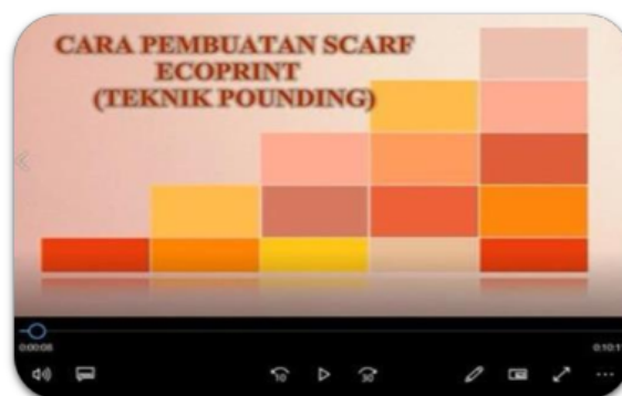
Gambar 1. Tampilan Video Pembuatan Produk Ecoprint

Pada tahap koordinasi antara tim pengabdian dengan kedua sekolah diperoleh hasil bahwa terdapat pembatasan jumlah peserta dan lamanya waktu kegiatan disebabkan masa pandemi Covid-19. Oleh karena itu saat pelaksanaan kegiatan di SMP N 10 Muaro Jambi yang dilaksanakan pada tanggal 25 Juli 2020 dan 1 September 2020 berjumlah 12 peserta yang terdiri dari guru dan siswa. Begitu juga pelaksanaan kegiatan di MTs N 6 Muaro Jambi pada tanggal 28 Juli 2020 berjumlah 15 peserta. Dengan kondisi tersebut tim pengabdian membuat video pembuatan produk ecoprint agar dapat menjadi media pembelajaran bagi guru ditunjukkan pada Gambar 1.