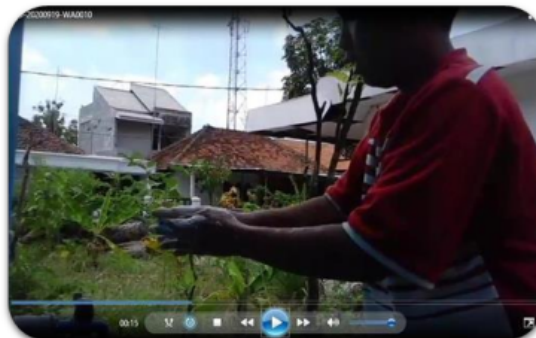
Gambar 4. Lomba video cuci tangan yang diikuti oleh siswa SDN Karangkembang