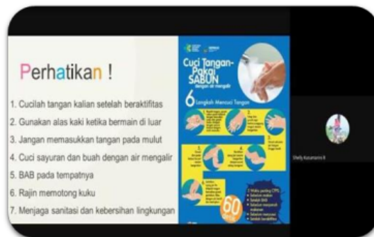
Gambar 3. Sosialisasi terkait cara mencuci tangan menggunakan sabun yang baik dan benar bersama siswa dan orang tua siswa SDN Karangkembang