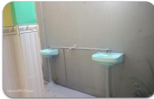
Gambar 5. Pembangunan fasilitas cuci tangan di SDN Karangkembang