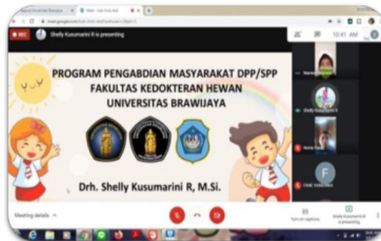
Gambar 2. Sosialisasi terkait infeksi STH menggunakan media google meet bersama siswa dan orang tua siswa SDN Karangkembang

Hasil kerja sama yang baik antara guru dan orang tua siswa juga menjadi faktor pendorong keberhasilan penerapan personal hygiene ini. Tanggung jawab yang dimiliki oleh orang tua dan guru dalam upaya menekan angka infeksi STH menjadi sangat sentral. Hal ini terbukti meskipun proses sosialisasi dilakukan secara daring ditengah keterbatasan yang ada saat pandemi ini seluruh elemen baik siswa, guru dan orang tua menyadari bahwa menjaga personal hygiene merupakan salah satu kunci agar badan sehat dan kualitas hidup menjadi meningkat.