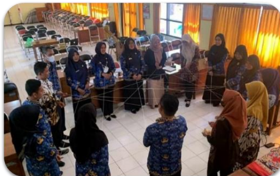
Gambar 2. Kegiatan praktik pelatihan workshop sekolah inklusi

Ketiga , tahap pelatihan yang berlangsung pada hari Jumat 28 Oktober 2022. Pada tahap ini guru berperan aktif dalam melakukan kegiatan praktik pembuatan perencanaan pembelajaran individual. Sebelum praktik membuat program perencanaan pembelajaran individual, guru menindaklanjuti hasil asesmen siswa berkebutuhan khusus di awal dengan membuat perencanaan pembelajaran individual sesuai kebutuhan yang ada di sekolahnya masing-masing peserta. Kemudian masing-masing kelompok mempresentasikan perencanaan pembelajaran individual yang sudah dibuat.