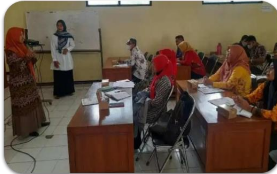
Gambar 1. Kegiatan penyampaian materi (tahap sosialisasi)

sharing pengalaman bersama, dan tanya jawab mengenai kondisi siswa berkebutuhan khusus. Kegiatan sosialisasi di Aula Disdikpora Kabupaten Jepara melibatkan 20 guru sekolah dasar dari 10 SD perwakilan dari setiap kecamatan yang ada di Kabupaten Jepara. Kegiatan ini berlangsung dengan khidmat, respon positif dan open minded dari peserta terhadap materi yang disampaikan. Guru juga saling bertukar pengalaman dalam mendampingi siswa siswa di sekolah dasar.