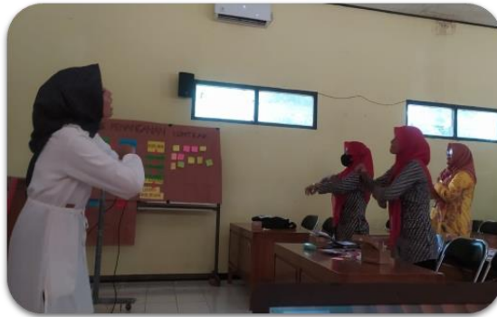
Gambar 3. Kegiatan praktik pendampingan

beberapa kelompok dan mempraktikkan secara langsung dan bergantian beberapa strategi pendampingan siswa berkebutuhan khusus. Setelah itu tim memberikan sugesti positif pada guru untuk bisa memberikan support system dalam pemberian intervensi yang menarik dilakukan bersama anak agar dapat mengoptimalkan potensi anak. Hal ini sejalan dengan pendapat Jauhari yang menyatakan bahwa penting adanya dukungan dan komitmen tinggi serta kerja keras melalui kolaborasi berbagai pihak dalam mewujudkan sekolah inklusi yang ramah bagi semua anak (Jauhari, 2017). Sehingga kegiatan pendampingan ini sangat tepat dilakukan sebagai bentuk kolaborasi bersama dalam mewujudkan terselenggaranya sekolah inklusi humanis.