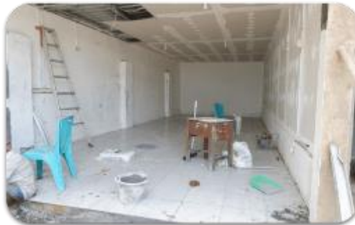
Gambar 6. Kondisi minimarket PPTQ An-Nail pada awal Oktober 2022

Visitasi atau kunjungan luring pertama ke PPTQ An-Nail dilakukan pada tanggal 1 Oktober 2022. Seharusnya kunjungan ini dilakukan di bulan September namun terhambat dikarenakan kesibukan dosen-dosen Institut Teknologi dan Bisnis Kalla yang merupakan pendamping kegiatan pengabdian ini. Pada kunjungan pertama ini, pembangunan tempat untuk minimarket PPTQ An-Nail belum sepenuhnya rampung. Sehingga yang pendamping lakukan adalah mengecek daftar produk-produk yang akan diadakan sebagai bagian dari persediaan untuk minimarket .