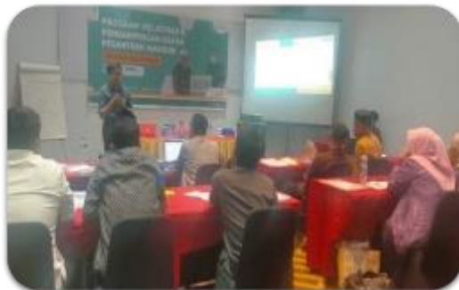
Gambar 2. Pemberian materi layout dan merchandising

Materi berikutnya tentu tidak kalah penting lagi, yaitu terkait dengan strategi pemasaran. Materi ini memberikan gambaran bagaimana usaha pesantren dapat menyusun strategi untuk memasarkan produk-produknya. Karena PPTQ An-Nail memutuskan untuk memiliki sebuah usaha minimarket maka materi layout dan tata letak isi toko menjadi materi yang sangat penting untuk dipahami, selanjutnya materi tentang layanan dan perilaku konsumen juga menjadi bagian penting dalam berjalannya usaha pesantren AN-Nail ini.