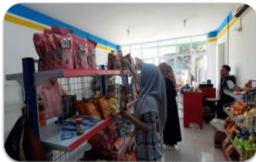
Gambar 11. proses penataan produk-produk minimarket PPTQ An-Nail oleh mahasiswa program studi Manajemen Retail Institut Teknologi dan Bisnis Kalla

Para mahasiswa mulai dengan menyortir jenis-jenis produk yang sama lalu kemudian menentukan posisi yang terbaik untuk produk-produk tersebut. Pada awal kedatangan kami pada visitasi ketiga ini, posisi produk sangat tidak jelas. Ada produk dengan jenis berbeda yang ditempatkan dalam 1 rak yang sama. Misalnya, produk sabun ditaruh di rak yang sama dengan produk makanan. Hal ini tentu saja menyalahi aturan ilmu penataan toko. Di sinilah peran para mahasiswa Institut Teknologi dan Bisnis Kalla untuk menempatkan produk yang sejenis di tempat yang seharusnya.