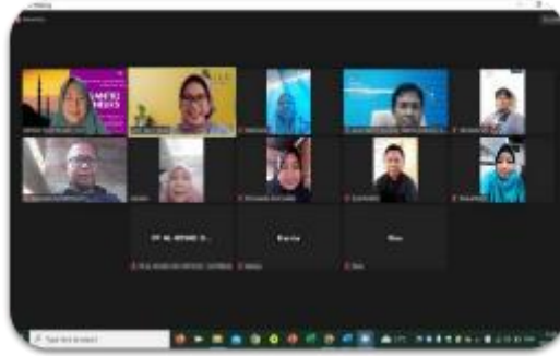
Gambar 5. Pendampingan melalui zoom ketiga

Visitasi atau kunjungan luring pertama ke PPTQ An-Nail dilakukan pada tanggal 1 Oktober 2022. Seharusnya kunjungan ini dilakukan di bulan September namun terhambat dikarenakan kesibukan dosen-dosen Institut Teknologi dan Bisnis Kalla yang merupakan pendamping kegiatan pengabdian ini. Pada kunjungan pertama ini, pembangunan tempat untuk minimarket PPTQ An-Nail belum sepenuhnya rampung. Sehingga yang pendamping lakukan adalah mengecek daftar produk-produk yang akan diadakan sebagai bagian dari persediaan untuk minimarket .