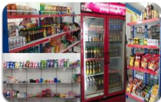
Gambar 12. Tampak posisi produk setelah dibenahi

Para mahasiswa mulai dengan menyortir jenis-jenis produk yang sama lalu kemudian menentukan posisi yang terbaik untuk produk-produk tersebut. Pada awal kedatangan kami pada visitasi ketiga ini, posisi produk sangat tidak jelas. Ada produk dengan jenis berbeda yang ditempatkan dalam 1 rak yang sama. Misalnya, produk sabun ditaruh di rak yang sama dengan produk makanan. Hal ini tentu saja menyalahi aturan ilmu penataan toko. Di sinilah peran para mahasiswa Institut Teknologi dan Bisnis Kalla untuk menempatkan produk yang sejenis di tempat yang seharusnya.