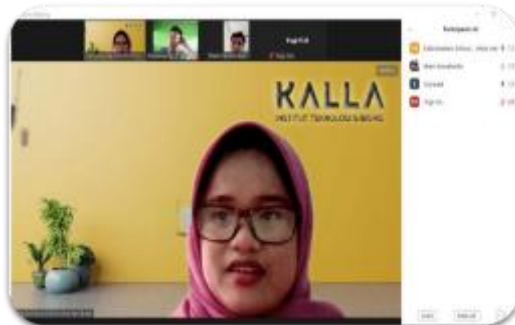
Gambar 3. Pendampingan melalui zoom pertama

pesantren berkoordinasi mengenai rencana pendampingan berikutnya akan seperti apa.