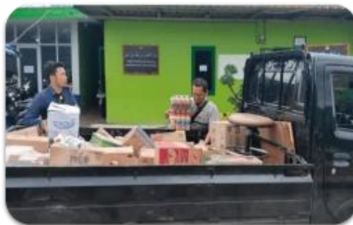
Gambar 7. Pengadaan persediaan barang untuk Minimarket PPTQ An-Nail 16 Oktober 2022

Animo para santri dengan dibukanya minimarket ini sangat besar, hal ini dapat dilihat dengan antrian santri yang menunggu minimarket terbuka. Selama bulan Oktober 2022, dapat dikatakan bahwa minimarket PPTQ An-Nail berkembang sangat pesat.