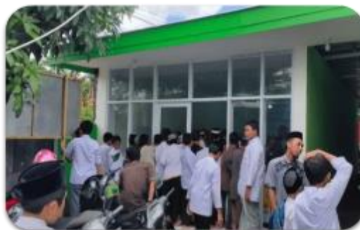
Gambar 8. Pembukaan perdana minimarket PPTQ An-Nail pada 17 Oktober 2022

Animo para santri dengan dibukanya minimarket ini sangat besar, hal ini dapat dilihat dengan antrian santri yang menunggu minimarket terbuka. Selama bulan Oktober 2022, dapat dikatakan bahwa minimarket PPTQ An-Nail berkembang sangat pesat.