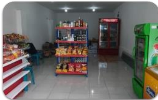
Gambar 10. Kondisi minimarket pada visitasi kedua tanggal 26 Oktober 2022

Penempatan produk-produk pada visitasi kedua terbilang masih acak dan berantakan sehingga sangat minimarket ini sangat membutuhkan bantuan dari segi penataan toko. Pendamping pesantren An-Nail memiliki latar belakang dosen program studi Manajemen Retail sehingga ilmu merchandising dapat diterapkan langsung di sini. Seperti yang dibahasakan sebelumnya, kondisi rak yang belum lengkap membuat penataan jadi belum bisa maksimal karena belum cukup tempat untuk menata produk yang sudah datang.