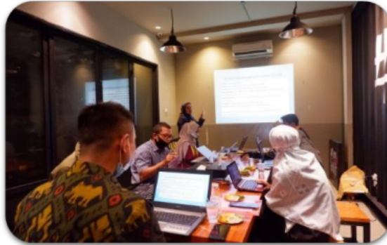
Gambar 2. Materi tentang pemanfaatan konten media sosial

Berikut adalah dokumentasi kegiatan ketika pemaparan materi oleh pembicara: