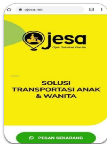
Gambar 5. Landing page OJESA

dapat meningkatkan pengambilan sampel karakteristik pelanggan dan komentar pada produk yang dipromosikan dan digunakan untuk perusahaan dalam riset dan memperbaiki kualitas sehingga kedepannya dalam meningkatkan penjualan. Kegiatan PKM ini sudah membantu startup dalam meningkatkan pemanfaatan media sosial dan engagement rate , hal ini dapat dilakukan dengan memiliki landing page dan pemahaman mitra dalam membuat iklan di media sosial secara efektif dan efisien. Gambar 5 menampilkan bentuk landingpage yang dibuat dengan berbagai informasi yang menampilkan keunggulan yang menarik bagi konsumen. Terdapat beberapa bagian halaman yang ditampilkan pada landingpage tersebut, diawali dengan headline , keunggulan produk, video profil mitra, testimoni konsumen dan call to action berupa tombol Whatsapp yang memudahkan pelanggan dalam menghubungi OJESA.