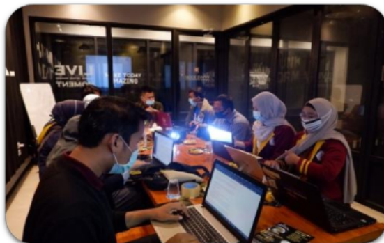
Gambar 3. Penyampaian materi landing page ke dalam Facebook ads