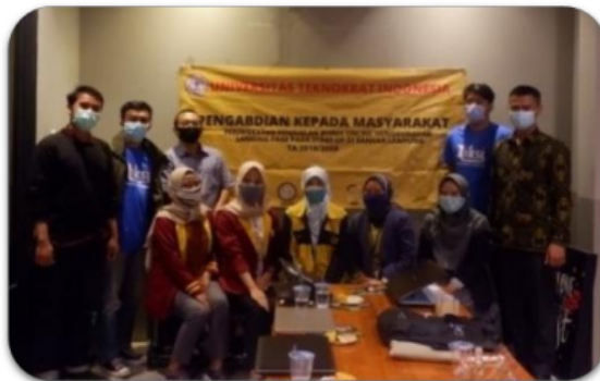
Gambar 4. Foto bersama tim pengabdian dengan mitra Ojesa

Manfaat yang diperoleh dari kegiatan ini jika dilihat dari sisi ekonomi dan sosial, mitra dapat meningkatkan pemahaman tentang bagaimana mengelola media digital untuk membangun komunikasi kepada target konsumennya. Selain itu, pemahaman tentang bagaimana jumlah pengikut pada media sosial memiliki pengaruh yang positif pada penjualan atau penggunaan jasa yang mereka miliki. Meski membutuhkan waktu yang tidak cepat, namun proses ini