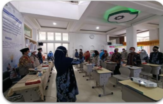
Gambar 5. Peserta kegiatan

Adapun implikasi atas kegiatan pengabdian kepada masyarakat ini menyangkut beberapa aspek penting diantaranya adalah kesadaran sekolah tentang pentingnya pendidikan budaya damai di sekolah, lahirnya beberapa peraturan dan kebijakan sekolah terkait PE serta tersosialisasinya toleransi dan semangat keberagaman kepada para siswa. Dari 8 sekolah yang menjadi sasaran implementasi program, 5 sekolah telah menghasilkan kebijakan penerapan PE di lingkungan sekolah diantaranya SMP Darul Faqih Indonesia, SMP Kristen Eleos, SMP Negeri 1 Wagir, SMP Islam Sunan Giri dan SMP PGRI 1 Wagir. Kebijakan sekolah ini menyangkut program kegiatan sekolah tentang sosialisasi dan implementasi kegiatan PE. PE dimaknai sebagai kegiatan berkesinambungan yang melibatkan siswa, guru dan lingkungan belajar.