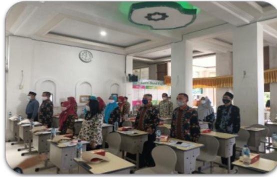
Gambar 4. Kegiatan diskusi oleh para kepala sekolah dan wakil kepala sekolah bidang kurikulum