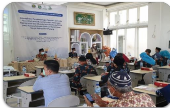
Gambar 2. Para kepala sekolah aktif mengikuti kegiatan

Tujuan utama kegiatan edukasi ini adalah untuk memperoleh kesepakatan dalam pemahaman yang utuh dan sama antara kepala sekolah sebagai pengambil kebijakan yang ada di sekolah SMP se-Kecamatan Wagir. Lebih khusus lagi, kegiatan ini berfokus pada melakukan edukasi pemahaman toleransi dan semangat moderasi beragama terhadap kepala sekolah untuk merumuskan kebijakan implementasi sekolah berbasis PE. Kepala sekolah diyakini harus mampu dan memiliki pendirian dan sikap yang lebih moderat dalam menerapkan kebijakan sekolah damai. Karena pendampingan ini dipusatkan di SMP yang berbasis pada pesantren, maka pembahasan mengenai sekolah berbasis PE akan lebih difokuskan dalam konteks agama Islam, dan ini juga bertujuan untuk memberikan pesantren sebagai model pelaksanaan dan merupakan kekayaan budaya dan peradaban muslim Indonesia (Fathurrochman et al., 2019).