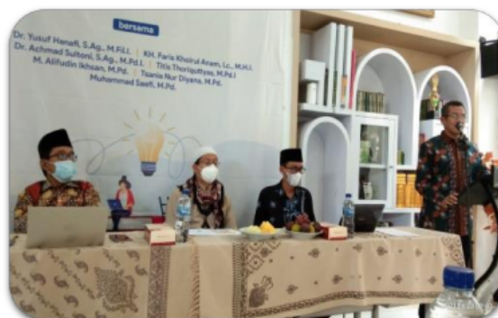
Gambar 3. Para narasumber menyampaikan paparan

Ancaman radikalisme baik dalam bentuk pemikiran maupun aksi semakin meningkat (Llorent-Bedmar et al., 2020), termasuk dalam pemikiran Islam itu sendiri (Saidi, 2017). Dalam bidang teologi, terdapat beberapa hal yang berpotensi menjadi pemicu munculnya paham radikalisme- takfiri , seperti hakimiyah dan al-wala wa al-bara . Hal ini nampak pula dalam bidang amaliyah ubudiyah fiqih, babon tasauf , hingga bidang teologis dan hukum Islam (Abdullah & Yani, 2009). Radikalisme Islam sebagai fenomena historis-sosiologis merupakan masalah yang banyak dibicarakan dalam wacana politik dan peradaban global akibat kekuatan media dalam menciptakan persepsi masyarakat. Banyak label yang diberikan untuk menyebut gerakan Islam radikal ini, mulai dari sebutan kelompok garis keras, ekstrimis, militan, Islam kanan, fundamentalis sampai teroris. Kondisi ini tentu akan mempengaruhi gaya berpikir seseorang dalam kerangka kehidupan beragama yang toleran, inklusif dan moderat. Radikalisme pemikiran dan aksi keagamaan jauh lebih berbahaya jika tidak segera ditangani dengan serius (Al-Zewairi & Naymat, 2017). Keterlibatan seluruh elemen dalam upaya pencegahan terhadap paham radikalisme sangat dibutuhkan (Llorent-Bedmar et al., 2020), termasuk dalam lingkup kecil seperti sekolah.