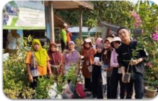
Gambar 4. Kegiatan pendistribusian tanaman unggulan

Pada kegiatan kedua dilakukan sosialisasi strategi harga jual produk herbyang meliputi materi pentingnya strategi harga, cara menghitung Harga Pokok Penjualan (HPP) dan penetapan harga. Apabila penetapan harga dilakukan dengan tepat, maka produk yang ditawarkan memiliki potensi untuk menarik minat konsumen, dimana harga yang tepat merupakan harga yang sesuai dengan kualitas produknya sehingga dapat memberikan kepuasan pada konsumen. Penetapan harga yang tepat ditentukan dengan empat macam metode diantaranya, yaitu menetapkan harga berdasarkan permintaan, menetapkan harga berdasarkan biaya, menetapkan harga berdasarkan laba, dan menetapkan harga berdasarkan persaingan (Maulani et al., 2017). Selain promosi, harga adalah penentu keputusan pembelian. Harga akan menilai biaya berdasarkan keuntungan yang dirasakan dari konsumsi penawaran. Pelanggan memiliki kesempatan untuk memilih dari berbagai penawaran, sehingga harga akan menjadi indikator komparatif terhadap keputusan pembelian (Purnamasari & Murwatiningasih, 2015). Dokumentasi sosialisasi strategi harga produk herbal tercantum pada Gambar 5.