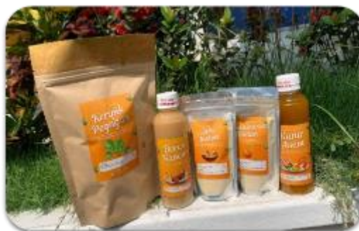
Gambar 7. Redesain label dan diversifikasi produk herbal

Sebagai bentuk tindaklanjut dari kegiatan sosialisasi ini, tim pengabdian masyarakat dan Kelompok Konservasi TOGA telah melakukan redesain kemasan yang memenuhi informasi sesuai dengan regulasi dan inovasi produk herbal untuk menambah diversifikasi produk dan memperluas pasar, seperti tercantum pada Gambar 7. Informasi yang tercantum pada desain kemasan memenuhi informasi terkait nama produk, produsen, nomor registrasi, masa simpan, komposisi, berat bersih dan kode produksi.