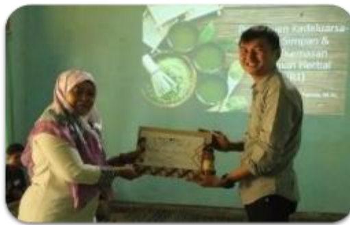
Gambar 6. Kegiatan sosialisasi penentuan masa kadaluarsa, masasimpan, dan informasi label/kemasan produk herbal

dan kemasan pada produk herbal di desa Growong telah tersedia, namun beberapa informasi tidak tersedia sesuai dengan regulasi antara lain informasi masa simpan, masa simpan dan komposisi produk yang belum lengkap. Penggunaan label dan kemasan baru yang lebih menarik dan informatif, akan berdampak pada mitra yang lebih percaya diri dalam memasarkan produk dan terbukti mampu meningkatkan pemasaran (Nurwidiana et al., 2019). Model kemasan mempunyai pengaruh positif dan signifikan terhadap variabel keputusan pembelian (Raharjo, 2022), sehingga redesain kemasan perlu dilakukan untuk kemasan produk yang kurang menarik dan informatif. Dokumentasi sosialisasi penentuan masa kadaluarsa, masa simpan, dan informasi label atau kemasan produk herbal tercantum pada Gambar 6.