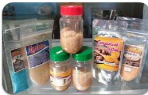
Gambar 2. Keterbatasan inovasi produk herbal

Berdasarkan pemaparan latar belakang masalah tersebut, dirancanglah program “Optimalisasi Peran Komunitas Konservasi Tanaman Obat Keluarga (Toga) Dalam Pemberdayaan Masyarakat” yang bertujuan untuk meningkatkan pengelolaan tanaman obat dan mengoptimalkan potensi produk herbal yang bernilai ekonomi sehingga berdampak untuk meningkatkan kesejahteraan masyarakat di Desa Growong.