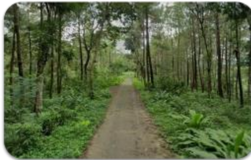
Gambar 1. Jalan di Desa Growong yang sulit akses pemasaran

Berdasarkan need assessment yang telah dilakukan, potensi produksi olahan dan tanaman herbal di desa Growong cukup melimpah namun masih belum dikelola dengan baik, hal ini menyebabkan kurang berfungsinya Kelompok Wanita Tani (KWT) dan terbengkalainya sarana produksi olahan jamu serta potensi yang dimiliki oleh masyarakat belum dimanfaatkan secara optimal. Kendala utama yang dialami oleh KWT terletak pada terbatasnya saluran distribusi pemasaran, sehingga produksi olahan herbal tidak berjalan berkelanjutan namun hanya dilakukan jika terdapat permintaan konsumen. Permasalahan yang menyebabkan pemasaran produk herbal tidak berjalan dengan optimal ini juga disebabkan oleh akses transportasi yang kurang mendukung (Gambar 1), diversifikasi produk yang dihasilkan masih terbatas, serta kemasan produk kurang menarik dan tidak informatif.