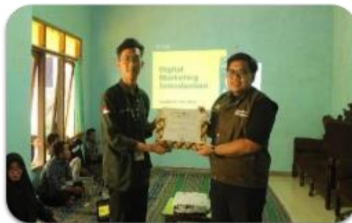
Gambar 8. Kegiatan sosialisasi digital marketing

Digital marketing memiliki beberapa keuntungan, salah satunya adalah dapat meningkatkan tingkat keberhasilan bisnis kecil dan menengah dibandingkan dengan metode tradisional. Tidak dapat dipungkiri bahwa penggunaan internet dan teknologi sangat luas di masyarakat. Akibatnya, banyak bisnis memilih untuk memasarkan produk mereka secara digital. Perkembangan teknologi yang pesat menimbulkan peluang bagi ekonomi digital nasional dan tantangan bagi dunia bisnis. Implementasi setelah diselenggarakannya sosialisasi digital marketing yaitu dengan pengembangan website Tanaman Obat Keluarga sebagai salah satu wujud media digitalisasi marketing yang berisi katalog produk herbal (Gambar 9), serta penggunaan sosial media dan marketplace sebagai media pemasaran. Dokumentasi sosialisasi digitalisasi marketing tercantum pada Gambar 8.