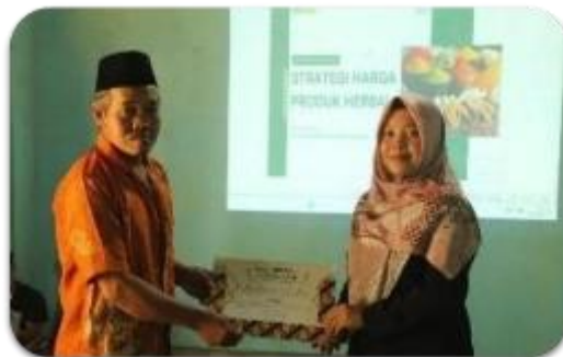
Gambar 5. Kegiatan sosialisasi harga produk herbal

Pada kegiatan kedua dilakukan sosialisasi strategi harga jual produk herbyang meliputi materi pentingnya strategi harga, cara menghitung Harga Pokok Penjualan (HPP) dan penetapan harga. Apabila penetapan harga dilakukan dengan tepat, maka produk yang ditawarkan memiliki potensi untuk menarik minat konsumen, dimana harga yang tepat merupakan harga yang sesuai dengan kualitas produknya sehingga dapat memberikan kepuasan pada konsumen. Penetapan harga yang tepat ditentukan dengan empat macam metode diantaranya, yaitu menetapkan harga berdasarkan permintaan, menetapkan harga berdasarkan biaya, menetapkan harga berdasarkan laba, dan menetapkan harga berdasarkan persaingan (Maulani et al., 2017). Selain promosi, harga adalah penentu keputusan pembelian. Harga akan menilai biaya berdasarkan keuntungan yang dirasakan dari konsumsi penawaran. Pelanggan memiliki kesempatan untuk memilih dari berbagai penawaran, sehingga harga akan menjadi indikator komparatif terhadap keputusan pembelian (Purnamasari & Murwatiningasih, 2015). Dokumentasi sosialisasi strategi harga produk herbal tercantum pada Gambar 5.