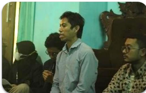
Gambar 3. Kegiatan sosialisasi budidaya dan manfaat TOGA

Kurangnya penerimaan informasi terkait TOGA menjadi salah satu penyebab rendahnya pemahaman masyarakat untuk memanfaatkan pekarangan rumah sebagai media penanaman tanaman TOGA serta pemanfaatan TOGA sebagai terapi alternatif komplementer (Lestari et al., 2022). Sosialisasi ini diharapkan dapat meningkatkan motivasi masyarakat dan komunitas konservasi TOGA untuk lebih giat dalam pemberdayaan tanaman obat. Dokumentasi sosialisasi budidaya dan manfaat TOGA tercantum pada Gambar 3.