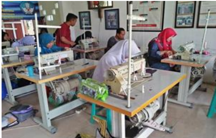
Gambar 3. Sarana dan prasarana menjahit di LKP Anugrah Pratama

diantaranya mesin jahit kecil 20 unit, mesin jahit high speed 18 unit, mesin obras 3 unit, ruang teori (ukuran 4x6 M 2 ), ruang praktek (ukuran 7x9 M 2 ), Meja potong kain, dan alat peraga pembelajaran (teori dan praktek menjahit).