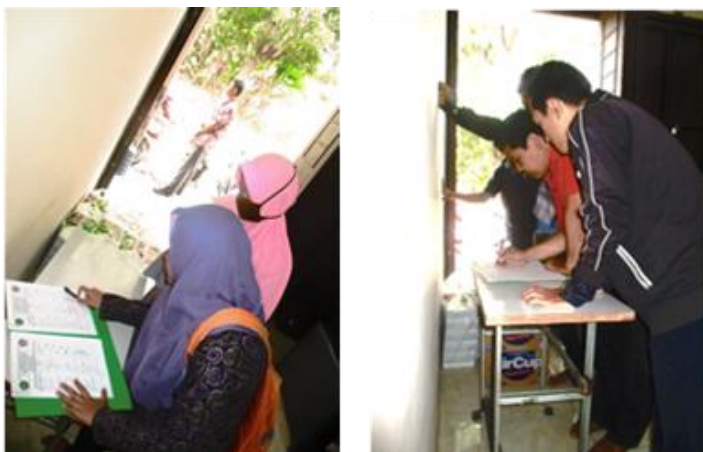
Gambar 2. Peserta penyuluhan sedang mengisi daftar hadir saat kegiatan penyuluhan

Jadwal kegiatan pemberdayaan masyarakat, pada tahap pertama yakni tahap persiapan, mulai tanggal 14 Agustus 2018 dimana pada tahap ini tim pelaksana bekerjasama dengan pengelola Lembaga Kursus dan Pelatihan (LKP) Anugrah Pratama menentukan peserta pelatihan yang menjadi sasaran dalam pengabdian kepada masyarakat. Peserta penyuluhan sejumlah 35 orang. Peserta penyuluhan semuanya merupakan peserta didik LKP Anugrah Pratama yang tinggal di Kelurahan Cipawitra Kecamatan Mangkubumi Kota Tasikmalaya yang berijazah minimal SMP atau paket B dengan usia antara 18-45 tahun.