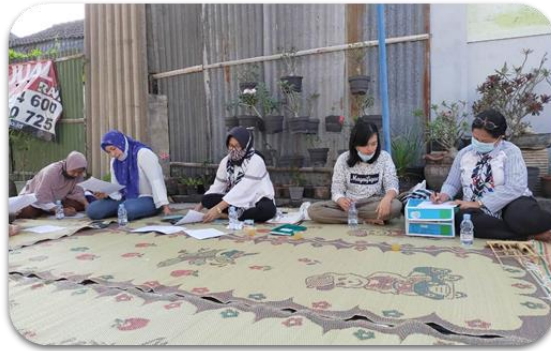
Gambar 3. Pengisian quisioner oleh para peserta

kesetaraan gender dan kekerasan dalam rumah tangga. Selain itu diberikan pula pertanyaan pancingan untuk pemanasan atau pengenalan terhadap isu yang akan didiskusikan bersama.