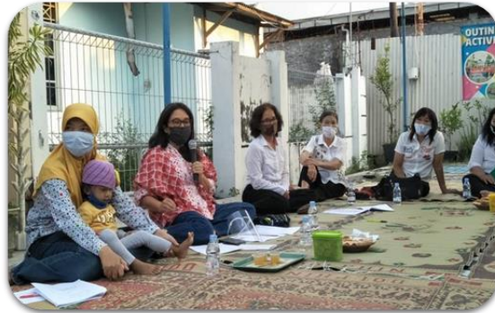
Gambar 4. Ceramah mengenai kesetaraan gender dan KDRT

Selain itu hasil evaluasi dari tingkat pemahaman peserta mengenai kesetaraan gender dan KDRT masih sangat rendah. Terbukti bahwa masih ada pemahaman bahwa perempuan itu harus di rumah, untuk mengurus dan membesarkan anak, sedangkan laki-laki harus bekerja dan tidak perlu mengurus anak. Sebagai tambahan ketika diajukan pertanyaan, jika ada tetangga yang bertengkar hebat, apakah tetangga bisa ikut campur dengan memberitahu? Para peserta masih menganggap bahwa permasalahan tersebut adalah permasalahan internal dalam rumah tangga, yang mana tetangga tidak bisa ikut campur.