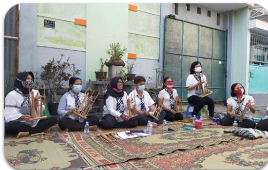
Gambar 2. Sajian musik angklung dari para peserta penyuluhan

Kegiatan pendidikan kesetaraan gender dan anti kekerasan dalam rumah tangga (KDRT) dilakukan di wilayah RT 04 RW 10 Perumahan Gading Permai, Grogol Sukoharjo. Kegiatan ini dimulai pertunjukan lagu dengan iringan alat musik angklung oleh ibu-ibu PKK. Rupanya ibu-ibu PKK ini aktif berlatih angklung seminggu sekali. Selanjutnya, acara dilanjutkan dengan sambutan dari Ibu RT dan perkenalan masing masing Anggota Tim Pengabdian masyarakat yang sekaligus menjadi narasumber dalam acara ini.