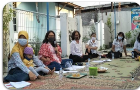
Gambar 4. Ceramah mengenai kesetaraan gender dan KDRT

Selain itu hasil evaluasi dari tingkat pemahaman peserta mengenai kesetaraan gender dan KDRT masih sangat rendah. Terbukti bahwa masih ada pemahaman bahwa perempuan itu harus di rumah, untuk mengurus dan membesarkan anak, sedangkan laki-laki harus bekerja dan tidak perlu mengurus anak. Sebagai tambahan ketika diajukan pertanyaan, jika ada tetangga yang bertengkar hebat, apakah tetangga bisa ikut campur dengan memberitahu? Para peserta masih menganggap bahwa permasalahan tersebut adalah permasalahan internal dalam rumah tangga, yang mana tetangga tidak bisa ikut campur.