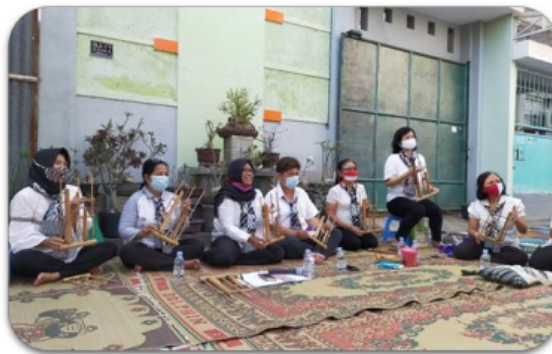
Gambar 2. Sajian musik angklung dari para peserta penyuluhan

Kegiatan pendidikan kesetaraan gender dan anti kekerasan dalam rumah tangga (KDRT) dilakukan di wilayah RT 04 RW 10 Perumahan Gading Permai, Grogol Sukoharjo. Kegiatan ini dimulai pertunjukan lagu dengan iringan alat musik angklung oleh ibu-ibu PKK. Rupanya ibu-ibu PKK ini aktif berlatih angklung seminggu sekali. Selanjutnya, acara dilanjutkan dengan sambutan dari Ibu RT dan perkenalan masing masing Anggota Tim Pengabdian masyarakat yang sekaligus menjadi narasumber dalam acara ini.