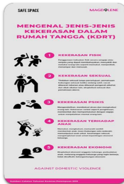
Gambar 5. Leaflet dibagikan kepada para peserta