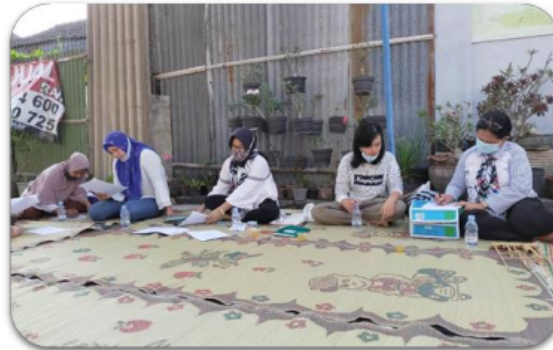
Gambar 3. Pengisian quisioner oleh para peserta

kesetaraan gender dan kekerasan dalam rumah tangga. Selain itu diberikan pula pertanyaan pancingan untuk pemanasan atau pengenalan terhadap isu yang akan didiskusikan bersama.