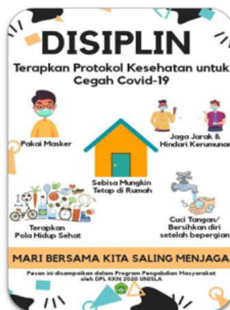
Gambar 1. Desain poster pencegahan Covid-19

Dalam tahap persiapan telah dihasilkan poster yang dibuat dan dirancang menggunakan aplikasi Canva dan dicetak dalam ukuran A3. Desain poster dapat dilihat pada Gambar 1.