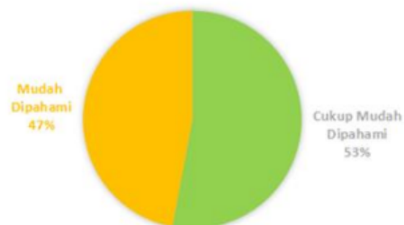
Gambar 3. Penilaian kemudahan poster untuk dipahami

Dari Gambar 3, dapat dilihat bahwa 53% warga desa menyatakan pesan dalam poster yang dibuat cukup mudah untuk dipahami, 47% sisanya menyatakan pesan dalam poster mudah dipahami. Poster ini dibuat dengan memasukkan gambar dan kalimat penjelas yang dibuat singkat dan padat. Tujuannya agar pesan lebih mudah dipahami oleh pembaca. Hal ini sesuai