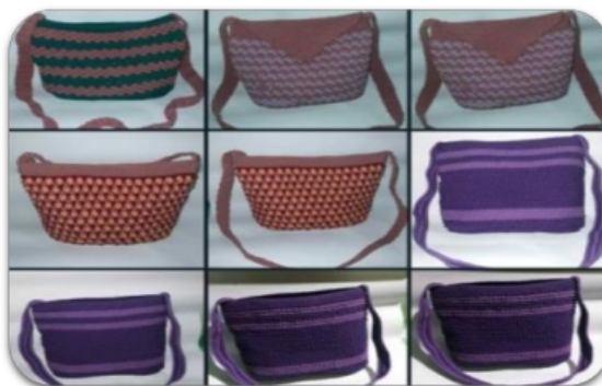
Gambar 6. Produk Tas