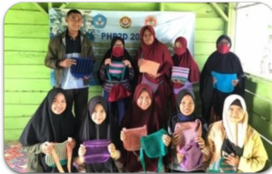
Gambar 5. Tas Noken

Benang yang sudah dihasilkan selanjutnya di olah dan digunakan dalam pembuatan produk yang mempunyai nilai harga tinggi dan dapat digunakan untuk kegiatan sehari-hari. Produk rajutan yang sudah familier ditengah masyarakat, diantaranya ada tas Noken Papua, rajutan songkok, rajutan penyambung masker untuk wanita berhijab, serta rajutan masker. Adapun hasil dari kegiatan pengabdian dari produk yang sudah dihasilkan oleh mitra sebagaimana pada gambar 5 dan 6.