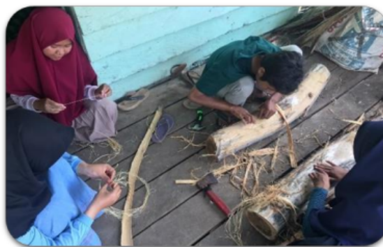
Gambar 3. Bahan Mentah Kulit Kayu Bus

Waktu yang telah digunakan sebagai implementasi dari penerapan ilmu dilaksanakan secara terus menerus sampai dihasilkannya produk. Mitra yang sudah mendapatkan keilmuan dari kegiatan ini selanjutnya melakukan tugas kerja secara mandiri hingga dihasilkan produk berupa benang hasil dari kulit kayu bus , produk yang dihasilkan memang masih dalam skala terbatas dikarenakan keterbatasan tenaga dan peralatan yang dapat memudahkan dalam memisahkan kulit kayu menjadi benang. Adapun hasil dari pemisahan serat kayu menjadi benang sebagai berikut: