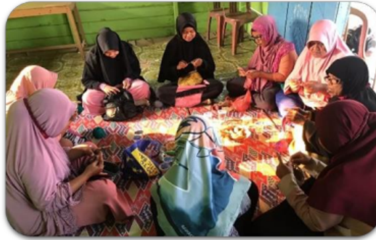
Gambar 4. Benang dari Serat

Benang yang sudah dihasilkan selanjutnya di olah dan digunakan dalam pembuatan produk yang mempunyai nilai harga tinggi dan dapat digunakan untuk kegiatan sehari-hari. Produk rajutan yang sudah familier ditengah masyarakat, diantaranya ada tas Noken Papua, rajutan songkok, rajutan penyambung masker untuk wanita berhijab, serta rajutan masker. Adapun hasil dari kegiatan pengabdian dari produk yang sudah dihasilkan oleh mitra sebagaimana pada gambar 5 dan 6.