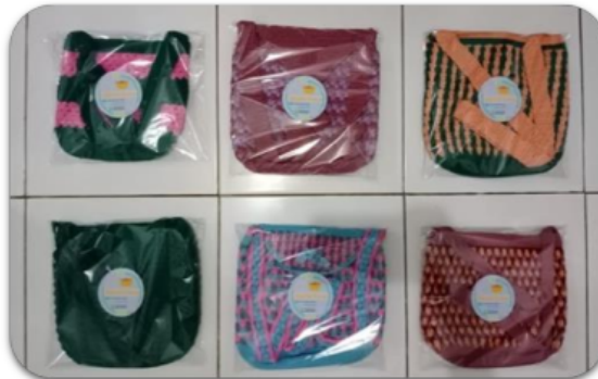
Gambar 7. Produk yang dipasarkan

Selain pemasaran melalui tradisional yang menggunakan tempat untuk memasarkan produk. Dari kegiatan pengabdian ini Tim pengabdian juga memberikan bantuan dalam menyiapkan cara pemasaran yang lebih efektif, mengingat akan kecanggihan teknologi internet. Pemasaran online yang sudah dilaksanakan bersamaan dengan promosi produk di terapkan melalui media sosial facebook , instagram , aplikasi jual beli lokal. Melalui aplikasi ini dapat dengan mudah menawarkan, mempromosikan produk baru dan juga memberikan keluasaan pembayaran melalui cash maupun melalui transfer bank. Melalui pemasaran online ini secara langsung warga belajar dalam memahami kemajuan zaman yang serba cepat dan praktis baik dalam pemasaran produk maupun dalam memahami cara penjualan online lainnya. Adapun cara pemasaran online yang sudah diterapkan dapat dilihat pada gambar 7 dan 8.