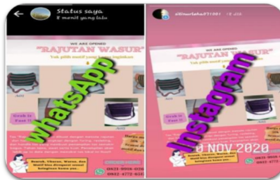
Gambar 8. Media Sosial yang digunakan

Semua produksi mulai proses awal, proses pembuatan hingga proses pemasaran telah dilaksanakan secara berkelanjutan hingga di batas waktu yang sudah ditentukan. Hal yang mulai digagas dari rangkaian kegiatan ini sebagai wujud nama dan tempat yang mudah dikenal dari produk hasil rajutan, maka sudah mulai diinisiasi dengan memberikan komunitas merajut dengan nama kitorang satu rajutan wasur . Hal ini memberikan semangat kepada mitra untuk lebih giat dalam bekerja dan melakukan konsistensi kegiatan dari hulu hingga hilir.