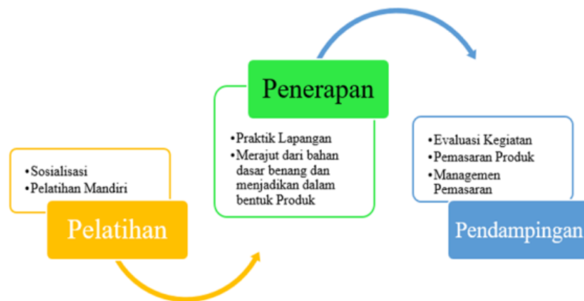
Gambar 1. Metode Pengabdian dalam Kegiatan PHP2D

Pelaksanaan dari metode pelatihan dilaksanakan secara bertahap langsung kepada masyarakat yang setiap pertemuannya dilaksanakan secara berpindah-pindah tempat. Adapun pelaksanaan dari metode pelatihan diantaranya terdapat kegiatan sosialisasi langsung kepada masyarakat sekitar. Hal yang disosialisasikan pada kegiatan ini meliputi upaya pengenalan kegiatan merajut yang secara khusus menambah keterampilan warga khususnya bagi ibu-ibu di waktu mengisi waktu luangnya dan dapat diinisiasi dalam memberikan gambaran pemasaran produk yang sudah dihasilkan. Adapun hal yang selanjutnya dilaksanakan langsung pelatihan mandiri tentang keterampilan merajut yang langsung di dampingi oleh tim pengabdian. Metode penerapan adalah lanjutan dari program pelatihan, yang langsung memberikan praktik kepada masyarakat. Adapun penerapan praktik merajut dengan menggunakan bahan yang sudah ada ditengah masyarakat. Selain merajut warga masyarakat juga diajarkan membuat dan menghasilkan benang yang dihasilkan dari kulit pohon bus yang endemik di Kabupaten Merauke. Selanjutnya dari hasil produk yang sudah dihasilkan dilakukan pembimbingan langsung untuk memasarkan guna memberikan bantuan tambahan penghasilan untuk membantu ekonomi warga.