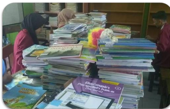
Gambar 2. Kegiatan Mengklasifikasi Buku

Mahasiswa dilibatkan dalam melakukan klasifikasi buku, karena koleksi buku SDN Madyopuro IV mencapai 1000 buku. Pengklasifikasian disesuaikan dengan jenis buku yang sudah ada pada aplikasi JIBAS. Misalnya buku agama, komputer, bahasa dll. Untuk berikutnya akan ditata pada rak yang sudah disediakan. Selanjutnya setelah melakukan instalasi program JIBAS yang disambungkan dengan alat pindai barcode . Komputer yang awalnya spesifikasinya belum mendukung kegiatan ini, ternyata diganti dengan komputer yang cukup baik. Hal ini tidak lain karena support dari Kepala SDN Madyopuro IV Malang. Hal ini sangat membantu proses pendataan buku, peminjaman dan pengembalian yang ada di SDN Madyopuro IV. Setelah melakukan kegiatan instalasi, berikutnya adalah kegiatan pelatihan program JIBAS oleh Tim pengabdian. Pustakawan juga diminta untuk mencoba melakukan pendataan menggunakan JIBAS.