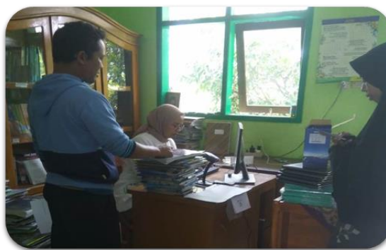
Gambar 3. Pendataan buku menggunakan JIBAS

Mahasiswa dilibatkan dalam melakukan klasifikasi buku, karena koleksi buku SDN Madyopuro IV mencapai 1000 buku. Pengklasifikasian disesuaikan dengan jenis buku yang sudah ada pada aplikasi JIBAS. Misalnya buku agama, komputer, bahasa dll. Untuk berikutnya akan ditata pada rak yang sudah disediakan. Selanjutnya setelah melakukan instalasi program JIBAS yang disambungkan dengan alat pindai barcode . Komputer yang awalnya spesifikasinya belum mendukung kegiatan ini, ternyata diganti dengan komputer yang cukup baik. Hal ini tidak lain karena support dari Kepala SDN Madyopuro IV Malang. Hal ini sangat membantu proses pendataan buku, peminjaman dan pengembalian yang ada di SDN Madyopuro IV. Setelah melakukan kegiatan instalasi, berikutnya adalah kegiatan pelatihan program JIBAS oleh Tim pengabdian. Pustakawan juga diminta untuk mencoba melakukan pendataan menggunakan JIBAS.